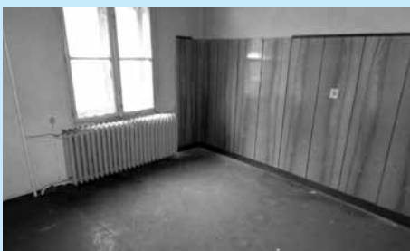
Lokal przy ul. Śrutarskiej 28 przeznaczony na sprzedaż.

Burmistrz Miasta Cieszyna ogłasza, że w dniu 14 maja 2014 r. w sali nr 13 Urzędu Miejskiego w Cieszynie (Rynek 1, I piętro) o godz. 10.00 odbędzie się ustny przetarg nieograniczony na sprzedaż działki nr 52 obr. 43 o pow. 205 m 2 zabudowanej budynkiem użytkowym nr 28 przy ul. Śrutarskiej w Cieszynie.