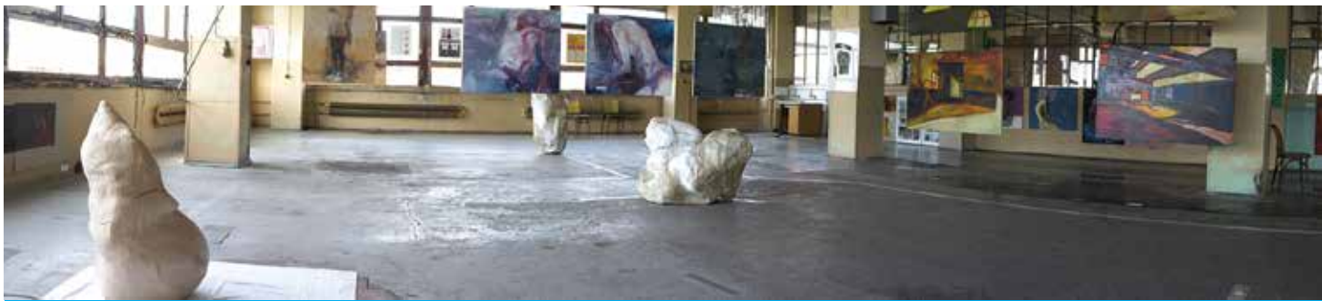
W przestrzeni Cieszyńskiej Wenecji zobaczymy m.in. rzeźby, obrazy, grafiki.