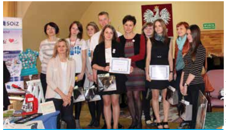
Młodzi przedsiębiorcy wymienili się doświadczeniami i wysłuchali rad ekspertów.

Na stoiskach targowych zaprezentowały swoje produkty młodzieżowe miniprzedsiębiorstwa: Pineapple, Ornamentum i Craft Lab (II LO im. Adama Asnyka, Bielsko-Biała), OwnWallet (I LO im. J. Smolenia, Bytom), Giftravel i Cukiernia u Wyspiana (III LO, Jastrzębie-Zdrój), Bijoux (Technikum nr 1, Jastrzębie-Zdrój), Firimend (Zespół Szkół, nr 1 Katowice), Rodzynek (LO im. K.K. Baczyńskiego, Kozy), Move Yourself (VII LO im. K.K. Baczyńskiego, Sosnowiec) oraz SOiZ-GROUP (Szkola Organizacji i Zarządzania, Cieszyn). Nagrodę „Gazetkę Przedsiębiorczości” w plebiscycie publiczności na najbardziej przedsiębiorczą firmę targów zdobyły dwa miniprzedsiębiorstwa – Bijoux z Technikum nr 1 w Jastrzębiu-Zdroju oraz SOiZ-GROUP ze Szkoły Organizacji i Zarządzania w Cieszynie. Atrakcyjne upominki dla zwycięzców ufundował Raiffeisen Polbank.