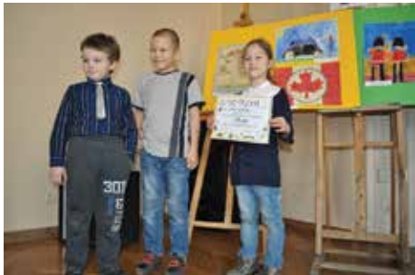
Autorzy prac, którym przyznano wyróżnienia w konkursie plastycznym.

21 marca zakończyła się pierwsza edycja międzyprzedszkolnego konkursu plastycznego „Kids Craft”, zorganizowanego przez Niepubliczne Przedszkole Anglojęzyczne „The Oxford Kids” w Cieszynie. Tematem prac był dowolny symbol kraju anglojęzycznego.