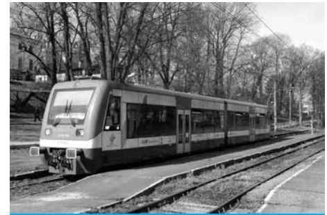
Czynione są starania na rzecz uruchomienia przez Koleje Śląskie linii Cieszyn – Katowice.

W piśmie wyszczególniona jest wyraźnie chęć uruchomienia regularnych połączeń, w formie 7–8 par pociągów dziennie. Dotychczasowa praktyka stosowana przez przewoźnika pokazuje, że im mniej kursów, tym mniej pasażerów. W okresie grudzień 2012–maj 2013, gdy miasto obsługiwane było przez 7 par połączeń, zdarzało się, że