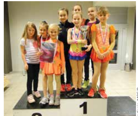
Klasa brązowa solistek.