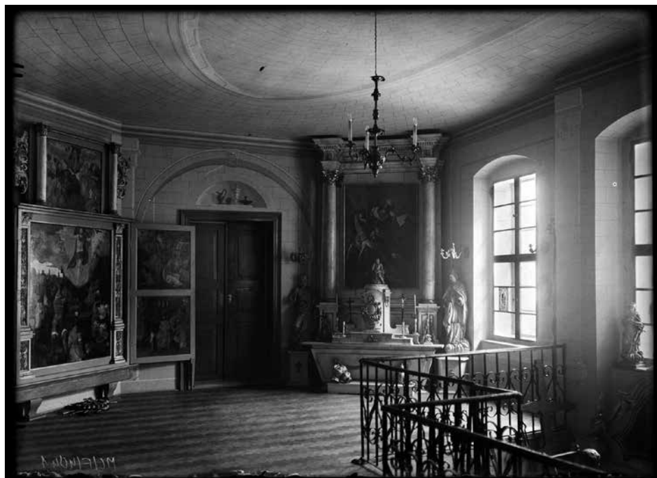
Muzeum wzbogaciło się o nowe eksponaty, a jak prezentowały się dawniej te starsze, zobaczymy na wystawie fotografii.